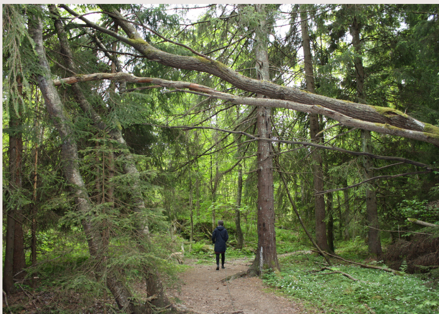
Frogn SV vil ha en markaplan for Frogn som strekker seg fra nord til syd med en bindende markagrense.